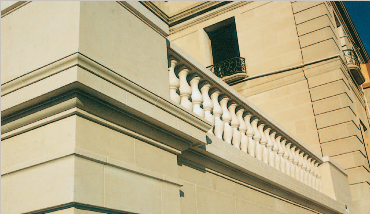
Résidence Beverly Hills - USA. Architectes : The Munselle Partnership Inc - USA et Pierre Barbe - Paris.