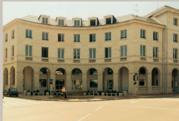
Hôtel de Région du Limousin - Limoges. Architectes : C. Langlois, J.L. Dufour, L. Arsène Henry, P. Sangenberg.